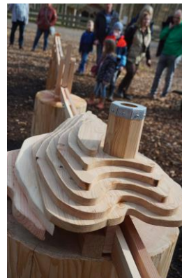
Bild 4: Die neue Kugelbahn „Steigerwaldparcours“ von Elena Köhler