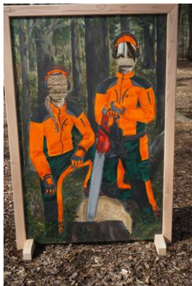
Bild 3: Mit einem Knips zum Waldarbeiter – die neue Fotowand am Baumwipfelpfad