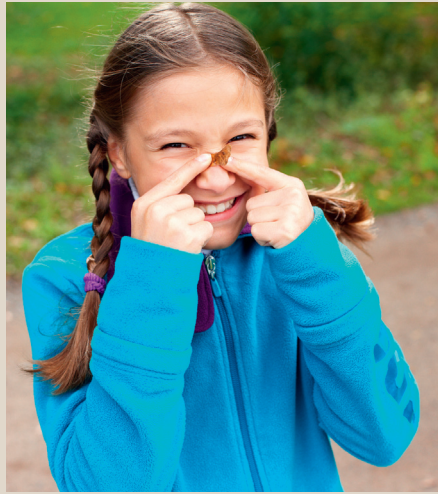
Ahornsamen suchen und auf die Nase zwicken – das Baumarten-Ratespiel von Station 3 bringt den Wald und seine Vielfalt näher!

Vieles am Wald ist faszinierend, reizvoll, geheimnisvoll und magisch: voller Zauber! Vorgänge und Gegebenheiten, die uns staunen lassen, die wir uns nicht erklären können, die uns auf einer anderen Ebene als den Verstand berühren.