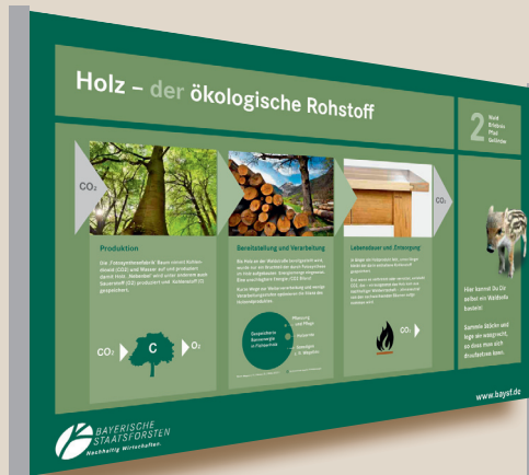
Insgesamt neun Tafeln mit abwechslungsreichen und interessanten Inhalten führen durch den Walderlebnispfad.