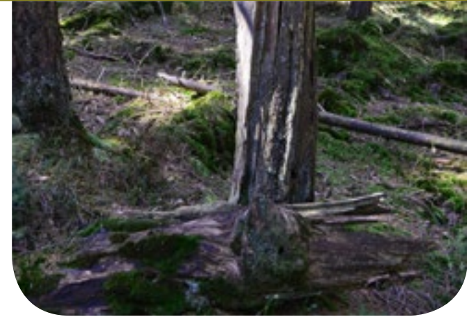
■ Totholz – ein wichtiges Element von Naturwäldern.

dere der extrem seltene Zarte Zwerg-Tauchkäfer erwähnenswert, der die besondere Schutzwürdigkeit dieses Lebensraums unterstreicht.