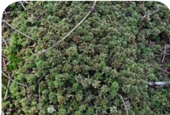
■ Torfmoose bringen das Moor in die Höhe.

Die Schmetterlingsfauna der Moore zeichnet sich durch einige spezialisierte und geschützte Arten wie Hochmoor-Gelbling und Hochmoor-Bläuling aus. Die meisten Schmetterlingsarten zählen zu den Nachtfaltern wie beispielsweise die Bergwald-Mooreule. Unter den Käferarten im Reservat ist insbeson-