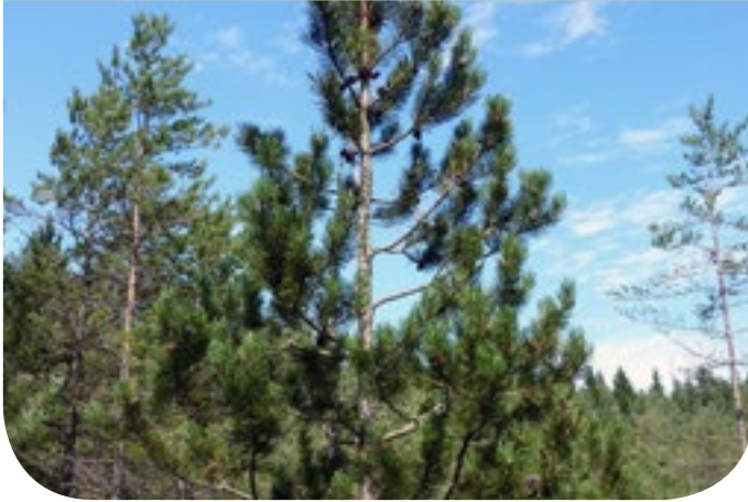
■ Am Übergang zwischen Wald und offenen Moorflächen findet die Spirke ihren idealen Lebensraum.