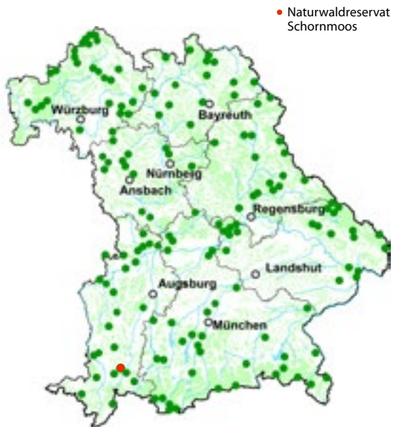
● Naturwaldreservate in Bayern.

Naturwaldreservate sind Wälder, die sich in einem weitgehend naturnahen Zustand befinden. Die natürliche Waldentwicklung läuft hier ungestört ab. Im Lauf der Zeit entstehen „Ur“-Wälder mit starken Bäumen und viel Totholz. In Bayern gibt es 159 Naturwaldreservate mit mehr als 7 000 Hektar Fläche. Für die Bayerische Forstverwaltung sind sie eine Art Freiluftlabor. Hier sammelt die Wissenschaft Daten über den natürlichen Wald und seine Entwicklung sowie über die artenreiche Tier- und Pflanzenwelt. Die Daten liefern wertvolle Erkenntnisse für Forstleute und Waldbesitzer, wie sie ihre Wälder naturnah bewirtschaften können. Gerade in Zeiten des Klimawandels sind diese Hinweise wichtig, damit auch in Zukunft gesunde und stabile Wälder in Bayern wachsen werden. Weitere Informationen finden Sie unter: www.naturwaldreservate.de .