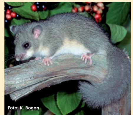
Abbildung 2: Die drei weiteren Bilche, die in Bayern vorkommen: Haselmaus, Baumschläfer und Siebenschläfer (v.l.n.r.)