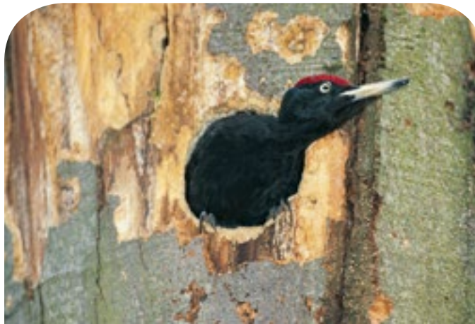
■ Der Schwarzspecht zimmert die größten Höhlen. Von seinen und den Höhlen anderer Spechte profitieren viele weitere Tierarten.

Außerdem wurden bereits über 400 Käferarten beobachtet, darunter seltene Arten wie der Zweifarbige Rotdeckenkäfer und der Punktrote Porlingskäfer. Auch Gehäuseschnecken wie die Bergglasschnecke profitieren vom hohen Nährstoffangebot. Die artenreiche Kraut- und Gehölzschicht ist Lebens-