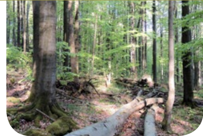
■ Totholz ist ein wichtiges Element aller Naturwälder.

raum für viele Schmetterlingsarten. Eine kleine Sensation war der Wiederfund des Natterkopf-Wippflügelalters, einer Art, die seit 1952 in Bayern als verschollen galt.