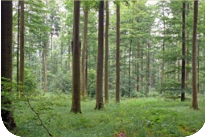
■ Auf dem wüchsigen Boden bilden die Bäume lange gerade Stämme.