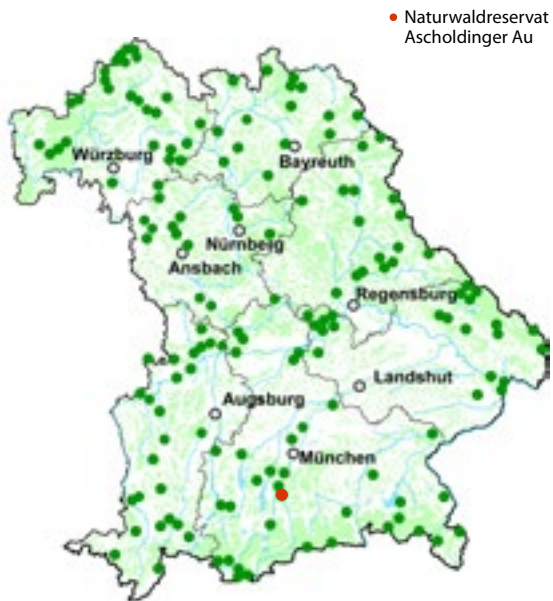
● Naturwaldreservate in Bayern.

Amt für Ernährung, Landwirtschaft und Forsten Holzkirchen Rudolf-Diesel-Ring 1a 83607 Holzkirchen Tel. 08024 46039-0