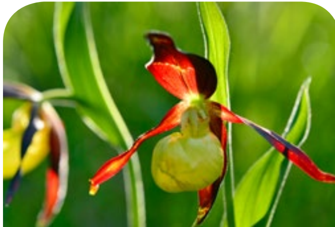
■ Der Gelbe Frauenschuh ist die wohl auffälligste unter den zahlreichen Orchideenarten im Naturwaldreservat.

In Flussnähe und insbesondere an den Weiden sind Biber sehr aktiv. Auch wenn man sie nur selten zu Gesicht bekommt, sind ihre Nagespuren und ihr Wirken sehr auffällig. Den extrem seltenen Sonderstandort nutzen aber auch zahlreiche kleine und versteckt lebende Arten. So bewohnen neben vielen anderen Käferarten im Reservat Ascholdinginger Au der Vierpunkt-Prachtkäfer und der Lärchenprachtkäfer absterbende und tote Bäume. Die Vielfalt an Schmetterlingen bereichern vor allem die unscheinbaren Nachtfalter. Unter diesen sind viele Spinnerarten wie Kiefernspinner und Eichenspinner. Aber auch Bläu-