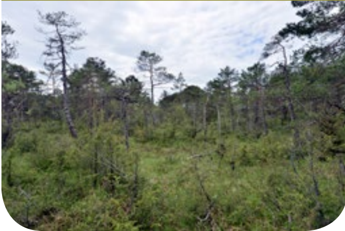
■ Unter dem lichten Kiefernschirm hält sich der Wacholder.