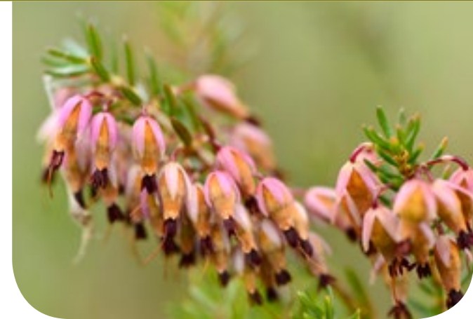
■ Die Schneeheide ist eine typische Pionierart offener, magerer Standorte der Flussschotterheiden.

linge und der Admiral sind hier an Sommertagen zu beobachten. In den zahlreichen kleinen, feuchten Senken leben seltene Schnecken wie zum Beispiel die Bayerische Quellschnecke.