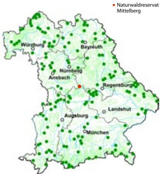
● Naturwaldreservate in Bayern.

Naturwaldreservate sind Wälder, die sich in einem weitgehend naturnahen Zustand befinden. Die natürliche Waldentwicklung läuft hier ungestört ab. Im Lauf der Zeit entstehen „Ur“-Wälder mit starken Bäumen und viel Totholz. In Bayern gibt es 159 Naturwaldreservate mit mehr als 7 000 Hektar Fläche. Für die Bayerische Forstverwaltung sind sie eine Art Freiluftlabor. Hier sammelt die Wissenschaft Daten über den natürlichen Wald und seine Entwicklung sowie über die artenreiche Tier- und Pflanzenwelt. Die Daten liefern wertvolle Erkenntnisse für Forstleute und Waldbesitzer, wie sie ihre Wälder naturnah bewirtschaften können. Gerade in Zeiten des Klimawandels sind diese Hinweise wichtig, damit auch in Zukunft gesunde und stabile Wälder in Bayern wachsen werden. Weitere Informationen finden Sie unter: www.naturwaldreservate.de .