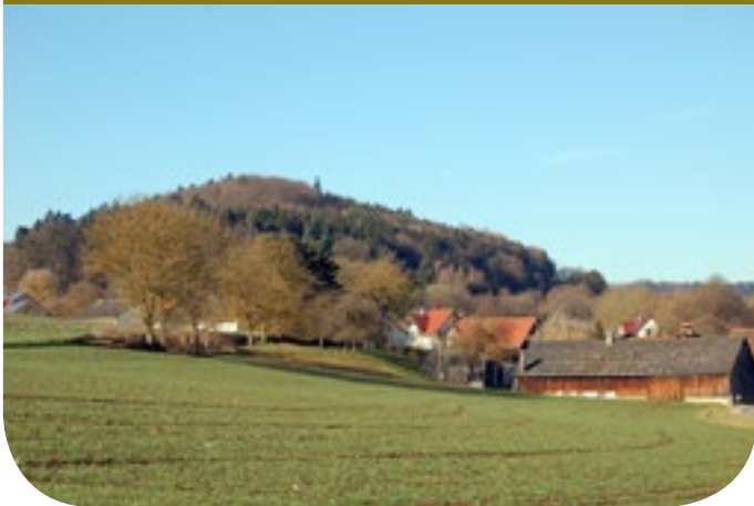
■ Hinter der Ortschaft Biberbach erhebt sich der Mittelberg.