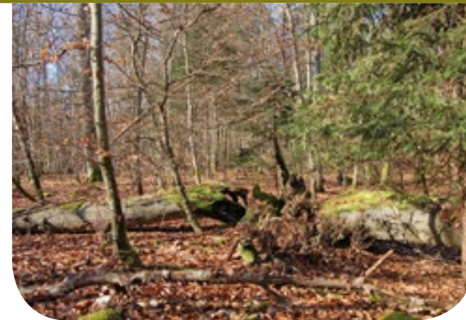
■ Totholz – ein wichtiges Element naturnaher Wälder.

Zahlreiche Pilzarten besiedeln das Totholz im Reservat. In den Wintermonaten bildet der Austernseitling seine Fruchtkörper an abgestorbenen Buchenstämmen aus.