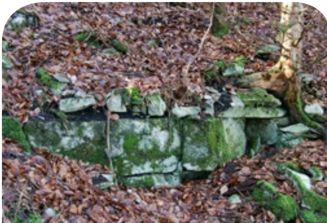
■ Felsblöcke des Jurakalks bilden den Untergrund.

Die Larven des Grünen Edelscharkäfers leben vorwiegend in Mulmhöhlen alter Eichen, Linden und Eschen. Die Käfer selbst, die zu den Rosenkäfern gehören, besuchen nach dem Schlüpfen gern die Blütenstände des Echten Mädesüß, aber auch Sträucher wie Gemeiner Schneeball oder Holunder.